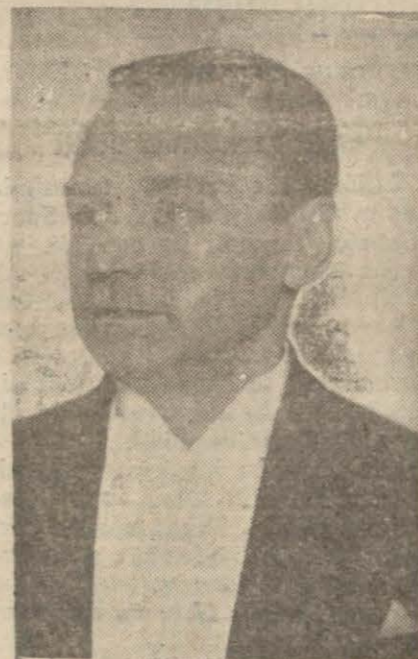
Dahiliye Vekili Faik Öztrak